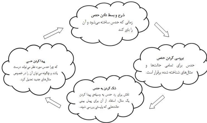
شکل ۲: فرآیند تولید حدس

ریاضی، حدس آگاهانه، می‌تواند از طریق الگوها تولید شده و بعد، با تخصیص‌های بیشتر، به قطعیت نزدیک شود. استدلال آوردن برای فرآیند حدسیه‌سازی، شامل تعمیم‌های بیشتری است که از بیان آنچه ممکن است درست باشد، به سوی علت یا «چرایی» درستی آن، حرکت می‌کند (میسن و همکاران، ۲۰۱۰). در مقیاس کوچک‌تر، حدس زدن قلب تفکر ریاضی است (شکل ۲).