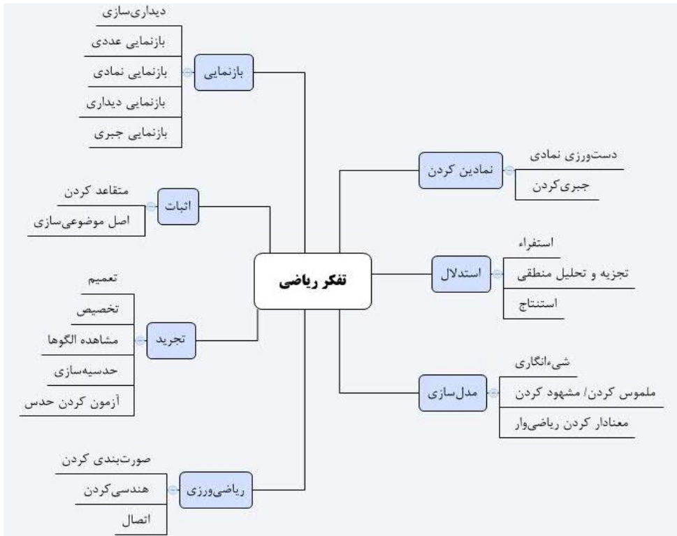
شکل ۱: فعالیت‌های تفکر ریاضی (کاراداگ، ۲۰۱۰)

در راستای رویکردهای ریاضی، در اوایل دهه ۱۹۷۰، گروه‌های تخصصی و محققان آموزش ریاضی، چشم‌اندازهایی در مورد چگونگی توصیف تفکر ریاضی پیشنهاد کردند که تقریباً همه آن‌ها، مرتبط با تفکر ریاضی پیشرفته ۱ بودند. در این راستا، ابتدا نظریه‌ای برای درک ریاضی دانشگاهی، تبیین شد (تال، ۱۹۹۱). با توجه به تحقیق‌های انجام‌شده درباره ماهیت تفکر ریاضی، سه حوزه نیازمند توجه است که عبارت از مفهوم‌سازی تفکر ریاضی پیشرفته، انجام پژوهش‌های میدانی، و امکان‌سنجی برای کاربرست نظریه‌های تبیین شده در موقعیت‌های واقعی کلاس‌های درس در آموزش عالی هستند. نگاهی به سیر تحولی پژوهش‌های انجام‌شده در خصوص تفکر ریاضی پیشرفته، چند مضمون مهم را برجسته می‌کند (نب، ۲۰۱۰) که می‌توان به