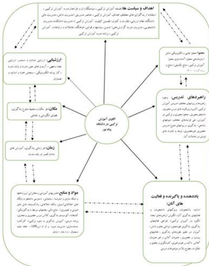
۱-۲: شماتیک الگوی آموزش ترکیبی در دانشگاه پیام نور

جدول شماره ۷ جدول نهایی عناصر آموزش ترکیبی در دانشگاه پیام نور را نشان می‌دهد. در ادامه شماتیک آموزش ترکیبی در دانشگاه پیام نور آمده است.