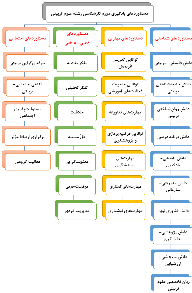
شکل ۲- دستاوردهای یادگیری مورد انتظار دانش آموختگان دوره کارشناسی رشته علوم تربیتی بر اساس یافته‌های پژوهش