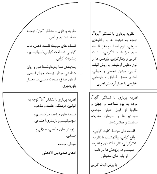
شکل ۱: نیمرخ رویکردهای نظریه پردازی برنامه درسی با الهام از نظریه انتگرال

ذهن و بدن هر چند از حیث هستی شناختی از هم جدا هستند اما از لحاظ معرفت-شناختی پذیرش اینکه ما از طریق بدن با دنیای پیرامون ارتباط برقرار می کنیم از شدت عدم امکان تحول معرفتی- روشی درباره یکپارچگی آنها می کاهد. گالاگهر و زهاوی ۱ (۲۰۱۲: ۹) با تأکید بر ادراک نا کامل ما از پدیده های مادی، شیوه سازنده ۲ را مورد توجه قرار می دهند. در دهه ۱۹۹۰ رویکردی با عنوان عصب پدیدارشناسی بر اساس فلسفه بدنمند و واقع گرایی شکل گرفته است که با نگاه فرا رشته ای ۳ و جدا فرض نکردن علوم از یکدیگر بر در هم تنیدگی بدن، مغز و بر هم کنش آنها در رابطه های بین فرد و محیط تأکید دارد. در این رویکرد مغز، بدن و محیط به اتفاق هم سیستم شناختی واحدی را تشکیل می دهند (کین ۴ ، ۱۳۹۶). ویلسون ۵ و کلارک