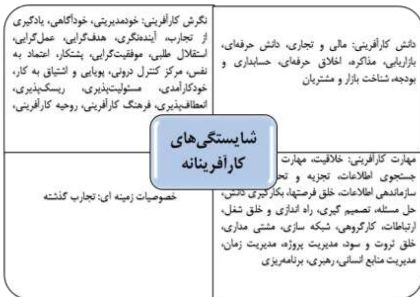
شکل یک - مدل شایستگی‌های کارآفرینانه

کارآفرینی، تمایل به کسب سود بالا، تمایل به یادگیری مادام‌العمر، بودن در شرایط مبهم و نامطمئن، آغازگر تغییر و مدیریت آن و مهارت در تدوین طرح شغلی، ۴۷ شایستگی به شکل مدل شایستگی‌های کارآفرینانه درآمد که در شکل یک مشاهده می‌شود: