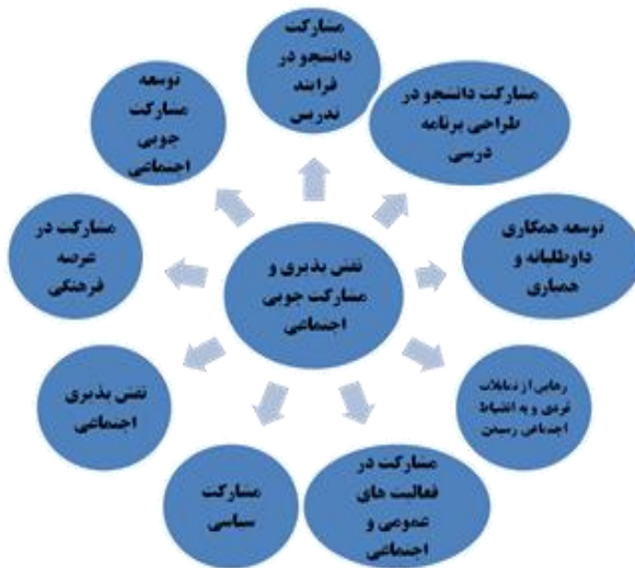
نمودار شماره (۵) مقوله نقش پذیری و مشارکت جویی اجتماعی بر اساس تجارب زیسته دانشجویان