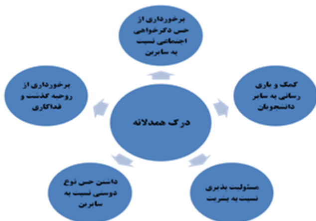
نمودار شماره (۷) مقوله درک همدلانه بر اساس تجارب زیسته دانشجویان

یافته‌های حاصل از این بخش از پژوهش بعد از حذف کدهای مشترک در قالب ۵ مقوله اصلی مانند: برخورداری از حس دگرخواهی اجتماعی نسبت به سایرین، برخورداری از روحیه گذشت و فداکاری، داشتن حس نوع دوستی نسبت به سایرین، مسئولیت‌پذیری نسبت به بشریت، کمک و یاری‌رسانی به سایر دانشجویان در طراحی برنامه درسی بود که بیانگر تجارب زیسته دانشجویان از مسئولیت‌پذیری اجتماعی و درک همدلانه در محیط دانشگاه است که در نمودار (۷) نشان داده شده است.