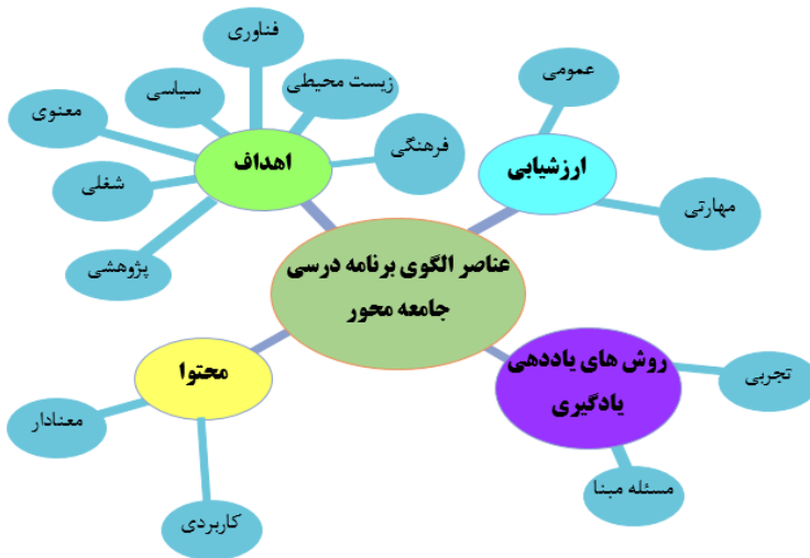
شکل ۳: شبکه مضامین ماهیت عناصر الگوی برنامه درسی جامعه‌محور

آمد که در ادامه با استفاده از این مفاهیم، کدهای نهایی از مبانی استخراج و پس از کدگذاری، ماهیت عناصر چهارگانه اهداف، محتوا، روش یاددهی - یادگیری و ارزشیابی برنامه درسی جامعه‌محور در نظام آموزش عالی با ۱۳ مفهوم: فرهنگی، سیاسی، شغلی، زیست‌محیطی، پژوهشی، فناوری، ارزش‌های انسانی و معنوی، معنادار، کاربردی، تجربی، مسئله مبنا، کلی و مهارتی نمایان شدند. در نهایت نتایج حاصل از فراترکیب توسط شبکه مضامین (شکل ۳) ترسیم شده است. این الگو می‌تواند به‌عنوان الگوی مفهومی در تدوین و تشخیص ماهیت عناصر برنامه درسی جامعه‌محور در نظام آموزش عالی جامعه‌محور و همچنین به‌عنوان راهنمای عمل در ترسیم مسیر پژوهش‌های آتی مورد استفاده قرار گیرد.