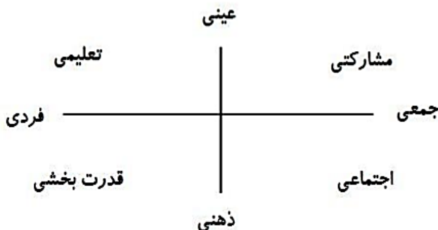
شکل ۲- پیوستار دو طرفه تدریس (کارنل، ۲۰۰۷)

از به روزترین مدل‌های ارائه شده الگویی است که به وسیله کارنل ۱ (۲۰۰۷) طراحی و تدوین شده است. مدل ارائه شده دارای دو محور عمودی و افقی در این زمینه است که از تدریس در رابطه با ذهنی و عینی بودن و یا فردی و جمعی بودن، چهار مفهوم شامل: مشارکتی ۲ ، تعلیمی ۳ ، قدرت بخش ۴ و اجتماعی ۵ را مورد بررسی قرار داده است.